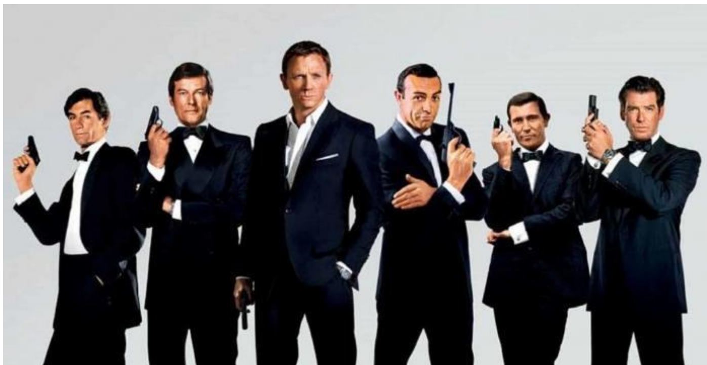
Tutti i James Bond al cinema: Timothy Dalton, Roger Moore, Daniel Craig, Sean Connery, George Lazenby e Pierce Brosnan

James Bond è una delle figure più iconiche del cinema moderno ed ogni film è sempre molto atteso. Per il Throwback Thursday , vediamo quali sono stati i migliori film per ogni attore che ha interpretato il famoso 007.